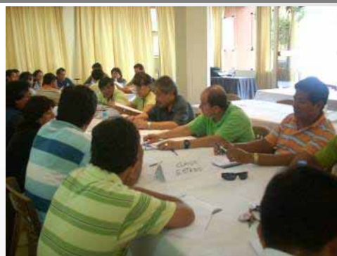
Grupos de Trabajo Estado Sesión Plenaria 19/09/08