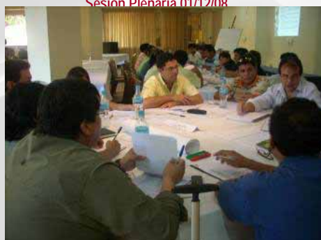
Grupos de Trabajo Empresas Sesión Plenaria 19/09/08