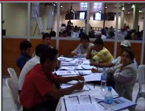
Grupos de Trabajo Tripartito Sesión Plenaria 01/12/08