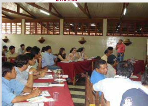
Exposición Grupo Empresas Sesión plenaria 29/09/08