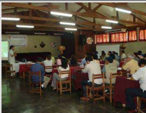
Sesión Plenaria 29/09/08