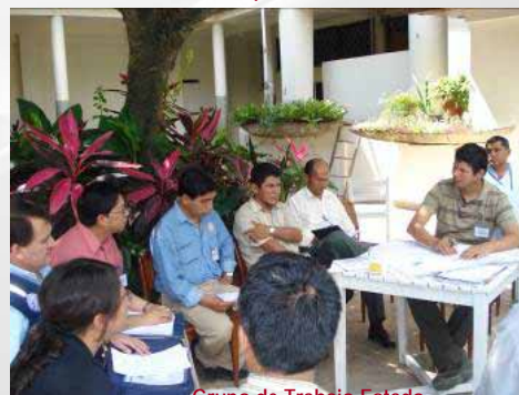
Grupo de Trabajo Estado Sesión plenaria 04/07/08