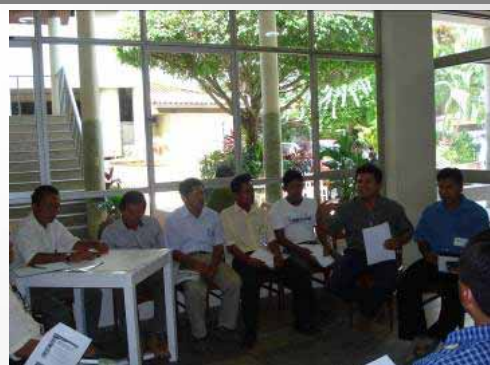
Grupo de Trabajo Organizaciones Indígenas Sesión plenaria 04/07/08