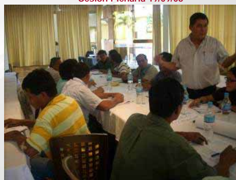
Grupos de Trabajo Organizaciones Indígenas Sesión Plenaria 19/09/08